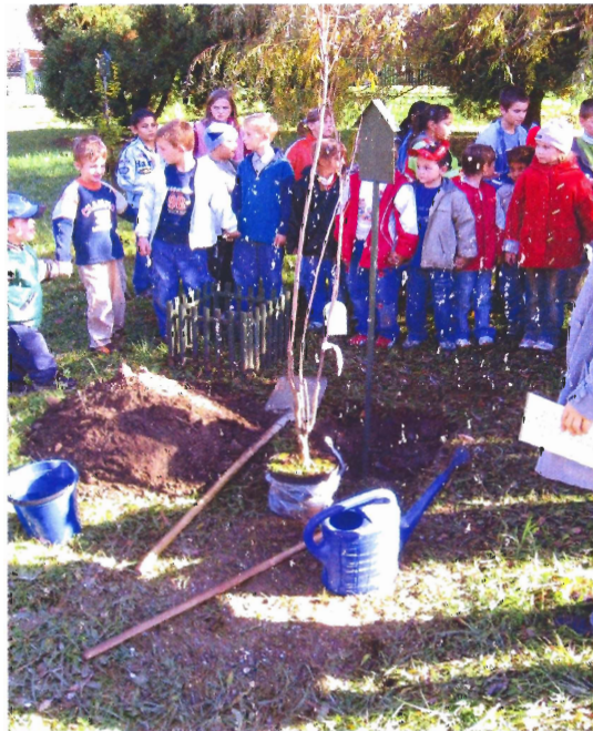
Sadenie stromčeka s prvkmi