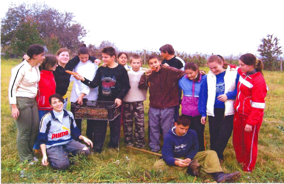
Vyberanie zeleniny v školskej záhrade