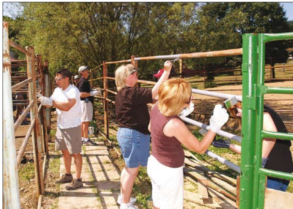
Krátko popoludní už boli výbehy pre zvieratká v novom šate.

Magdaléna FECURKOVÁ