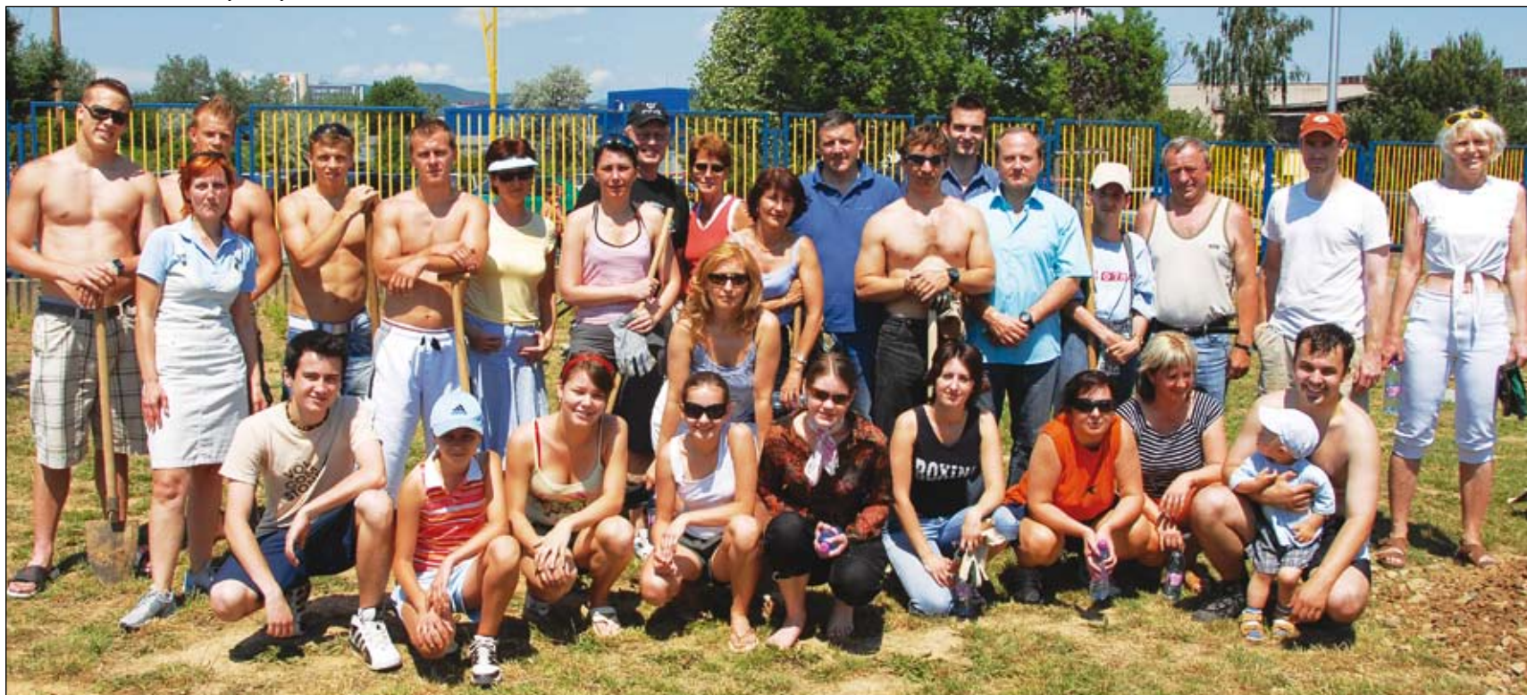
Spoločná fotografia na záver. Brigádnikov v Detskom športovom a zábavnom areáli na Alejovej ulici, väčšinu zamestnancov úseku Generálneho právneho zástupcu, prišli podporiť aj hokejisti HC Košice.

kus práce. A pri dobrom guláši sa našiel čas aj na kus reči.