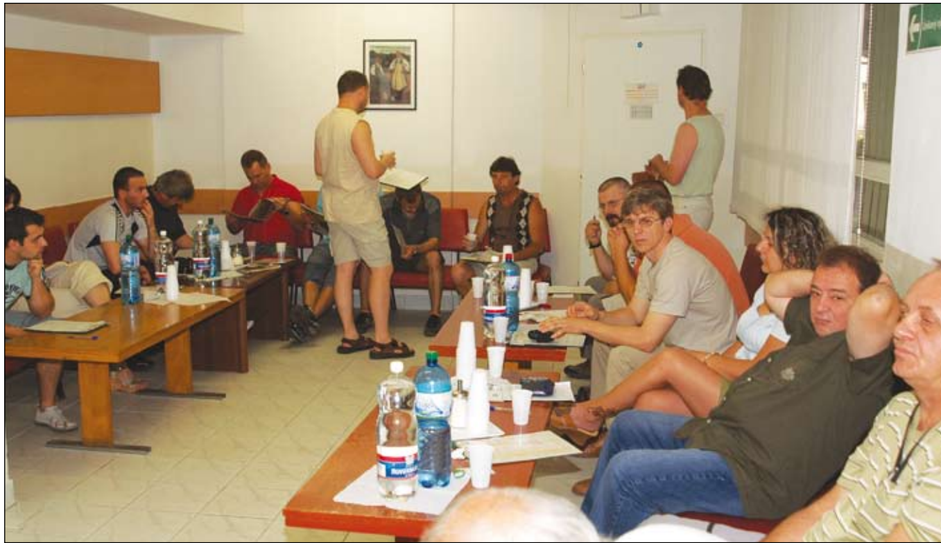
Čakáreň bola plná darcov krvi už o šiestej hodine ráno.

Piatok, 8. júna, šesť hodín ráno. Čakáreň Hematologicko-transfuziologického oddelenia polikliniky šačianskej nemocnice v areáli U. S. Steel Košice je plná. Do oficiálneho začiatku Hutníckej