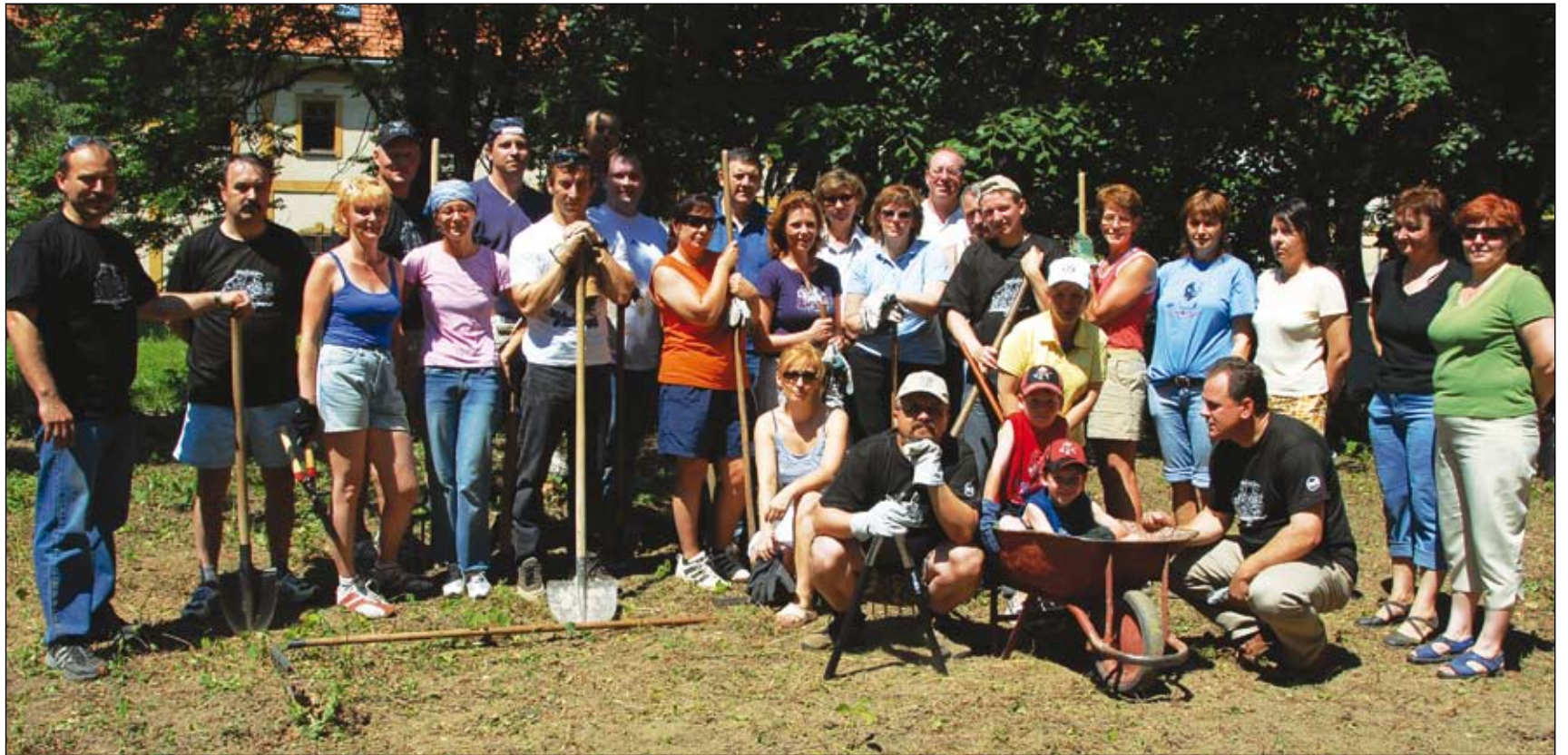
V Dome pokojnej staroby A. Fischera-Colbrieho na Južnej triede sa zišla skvelá partia, ktorá urobila poriadny kus roboty.

V Dome pokojnej staroby A. Fischera-Colbrieho na Južnej triede v Košiciach sa zišla partia odhodlaná spraviť za necelých päť hodín z niekoľko árového pozemku plného nahromadených suchých konárov, lístia a divo rastúcich kríkov priestor pre architektu, ktorého návrhy a ich realizácia premenia zanedbaný kus zeme na oázu pokoja a oddychu. Pre starých, ktorí